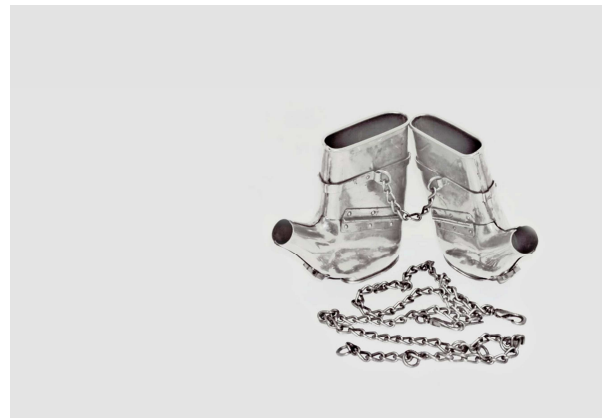
Cheyenne Schiavone - Instruments of Disciplines - Gloves - 2015 - Aquarelle sur papier - 50 x 65 cm

Retrouvez l'exposition « /Earl Grey » de Cheyenne Schiavone du mercredi 18 au samedi 21 février 2015, de 14h à 19h30 au sein de l'espace Vitrine-65 , 65, rue Notre Dame de Nazareth 75003 Paris.