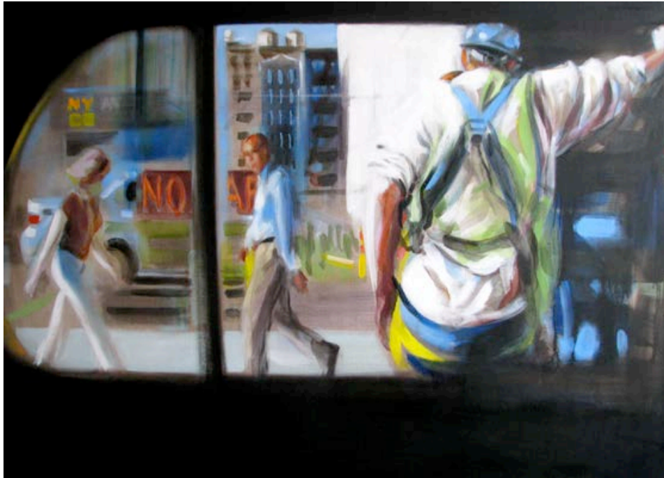
«Transit, III – NY-NO-AR » 2013 – huile / toile – 100 x 140 cm

Le conservateur Colin Lemoine, critique d'art au Journal des Arts et à L'Oeil, souligne aussi qu'« Isabelle Bonzom sait la fragilité comme la grandeur de l'instant décisif, sa charge d'inconnu comme sa discrétion universelle. Ici un carrefour peuplé par la solitude, là une rue habitée par des anonymes ; ici un arbre entraperçu, là une ombre probable. Tout se fond, s'accorde. Tout paraît nécessaire et évident, comme si le monde se voyait enfin mis en mots, en formes. Les choses prennent sens ».